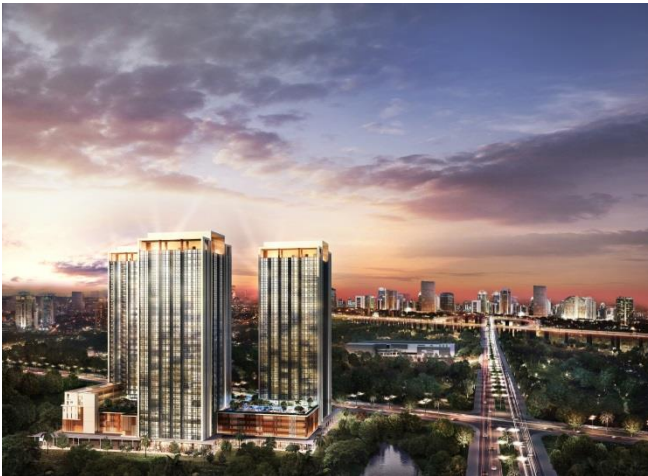
Gambar Ilustrasi Keseluruhan Proyek

Tokyo, JEPANG, 12 Juli 2017 – Tokyu Land Corporation (Kantor Pusat: Minato-ku, Tokyo, Presiden Direktur: Yuji Okuma) secara resmi mengumumkan telah melakukan acara Topping Off untuk proyek kondominiumnya “BRANZ BSD” yang kini telah merampungkan pembangunan tahap pertamanya yang disebut BRANZ BSD Ai , terdiri dari 3 tower dengan 1.256 unit kondominium. Kondominium “BRANZ BSD” secara total akan terdiri dari tiga tahap pembangunan yang terdiri dari kurang lebih 3.000 unit kondominium dan direncanakan akan selesai di tahun 2018. “BRANZ BSD” dikembangkan oleh anak perusahaan Tokyu Land Corporation di Indonesia, PT. Tokyu Land Indonesia (Kantor Pusat: DKI Jakarta, Presiden Direktur: Keiji Saito) yang bekerjasama dengan Mitsubishi Corporation (Kantor Pusat: Chiyoda-ku, Tokyo, Presiden Direktur: Takehiko Kakiuchi).