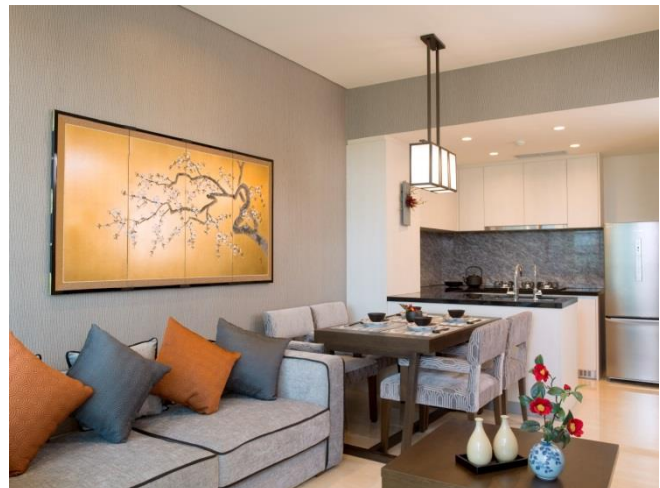
Foto Show Unit dengan 2BR