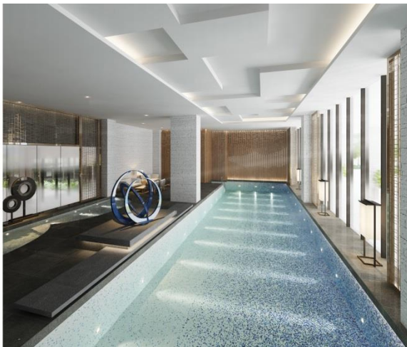
Gambar Ilustrasi Kolam Renang Indoor